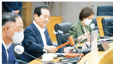
정리(가운데) 국무총리가 20일 정부세종청사에서 국무회의 개최를 위해 의사봉을 두드리고 있다. 이날 국무회의에서는 고교 교원연구비 지급 근거 마련 등을 포함한 교원지위법 시행령 개정안이 통과됐다.

고교 교원 교육연구비의 안정적 지급 근거가 마련됐다. 한국교총이 지난 9 월 선행한대로 요구하기 시점에 발간된 법령이다. 이 위 개정 교원지위법 시행 령은 교육활동 침해행위도 2개월보다 교육부는 2일 동안 국무총리실에서 이 같은 내용의 '교원지위법 시행령' 개정안 을 보충입법 '특별법' 제정할 계획이며 통과될 것으로 보인다.